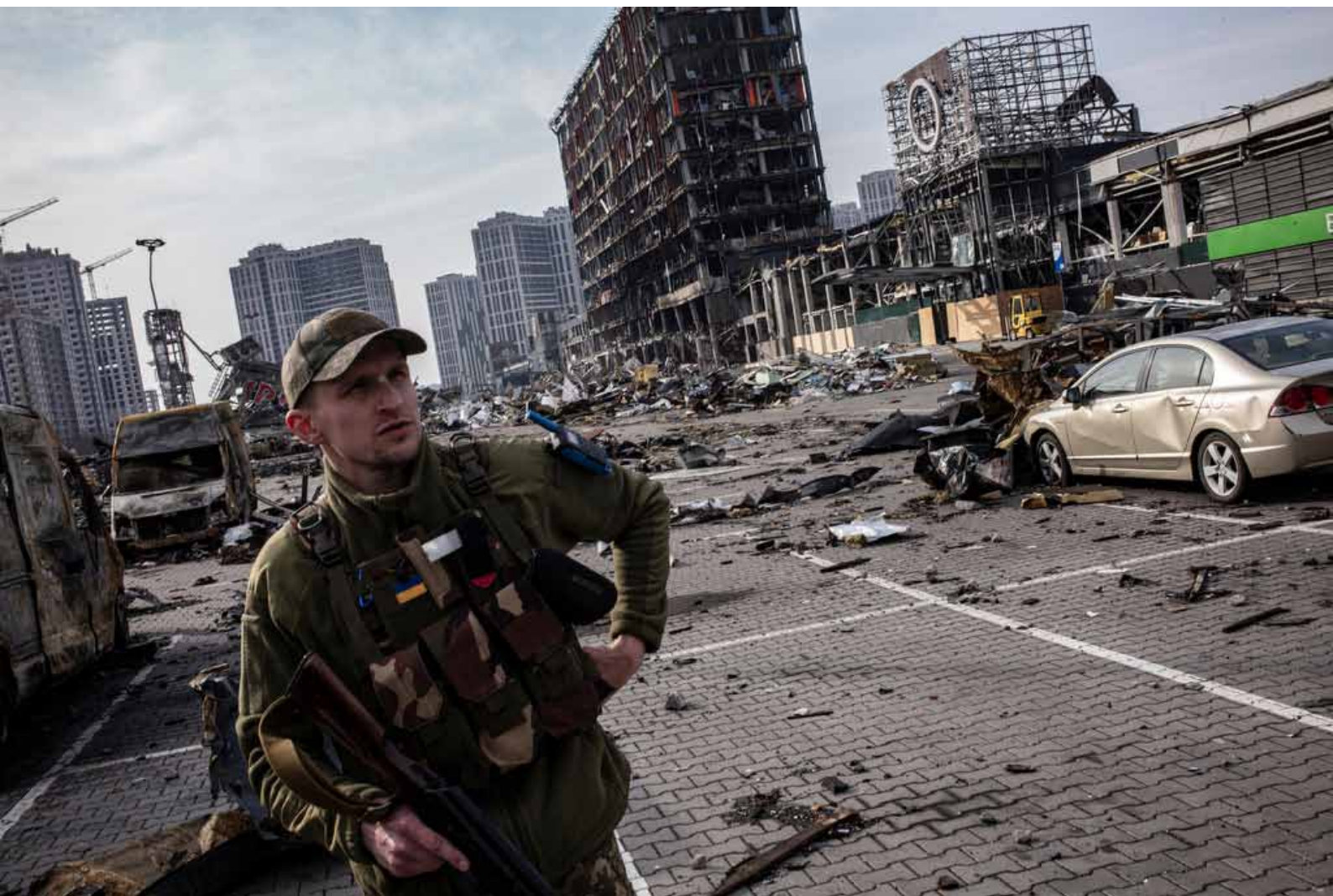
Ukraine, Kyiv, le 29 mars 2022. Centre commercial Retroville bombardé par l'armée russe dans la nuit du 20 mars Reportage réalisé en commande pour L'OBS